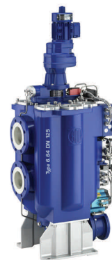
Полная очистка СОЖ