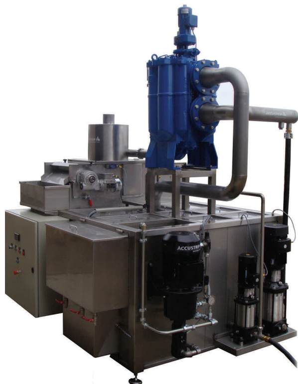
АФУ DN (100, 125, 150)